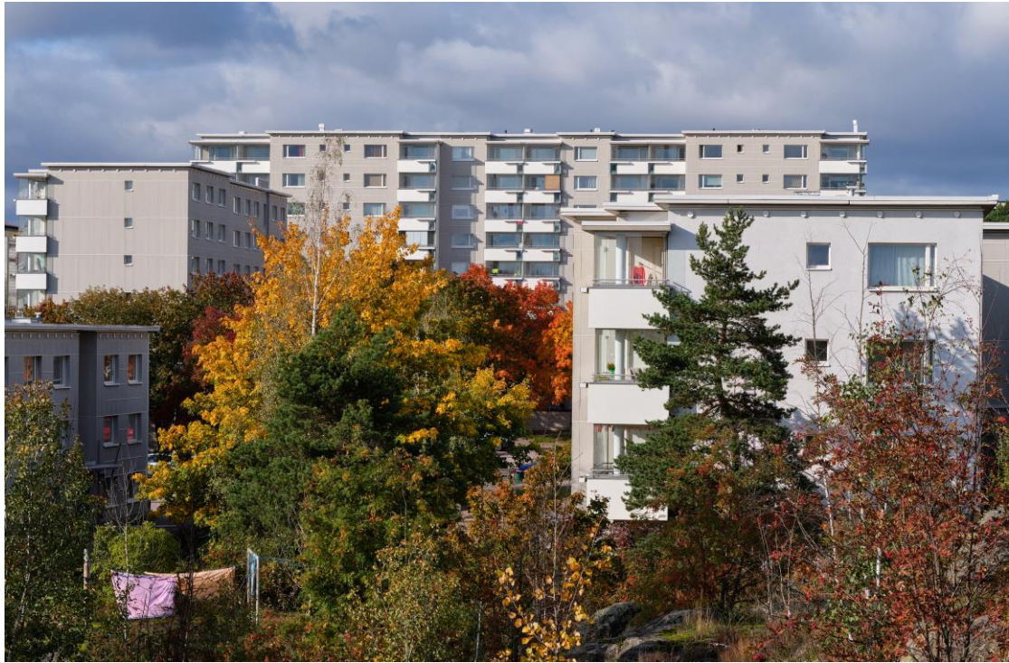
Kuva 7. Kerrostaloja ja pyykit kuivumassa. Kuvan käyttö sallittu vain tämän artikkelin yhteydessä.