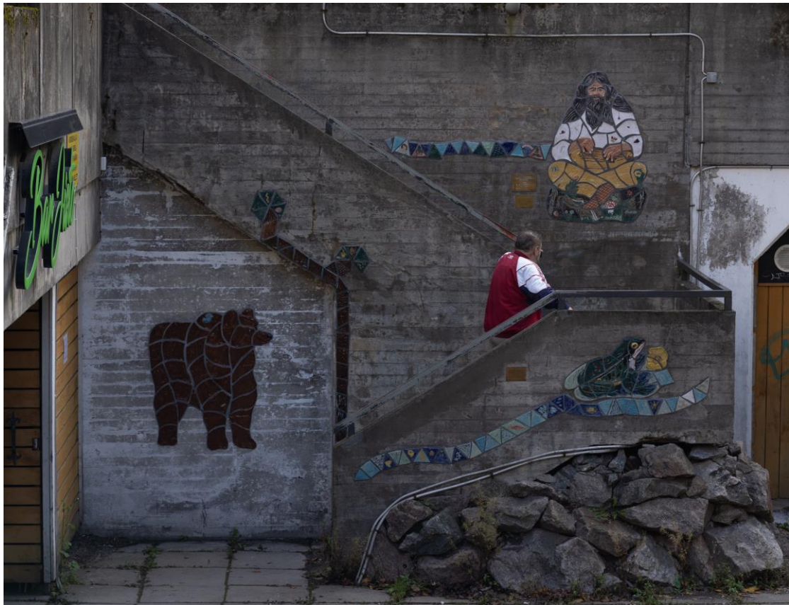
Kuva 8. Baarin edustaa. Kuvan käyttö sallittu vain tämän artikkelin yhteydessä.