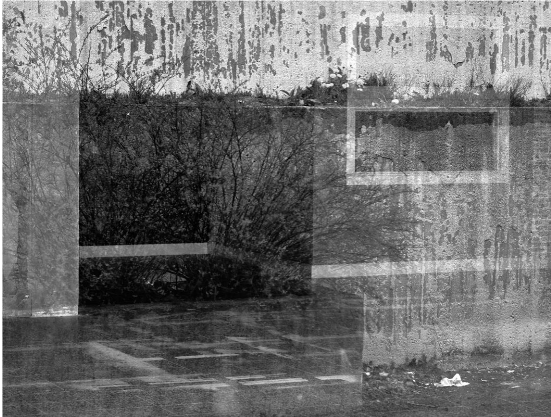
Kuva 5. Heijastus ikkunassa. Kuvan käyttö sallittu vain tämän artikkelin yhteydessä.

Dokumentaarisesta kuvasta erottuvat kuvat, joiden visuaalinen tyyli on vahvemmassa osassa suhteessa esittävyYTEEN. Kuvan ideana voi olla vahva graafinen muoto tai värien kontrasti, mutta kuvattu kohde ei välttämättä edes erotu selvästi. Äärimmilleen vietyinä kuva voi olla täysin abstrakti, eikä yhteyttä kuvauskohteeseen tunnista. Abstraktia kuvaa lähestyy ikkunaan heijastuva näkymä, josta kerrostalon hahmoa vaivoin tunnistaa (Kuva 5).