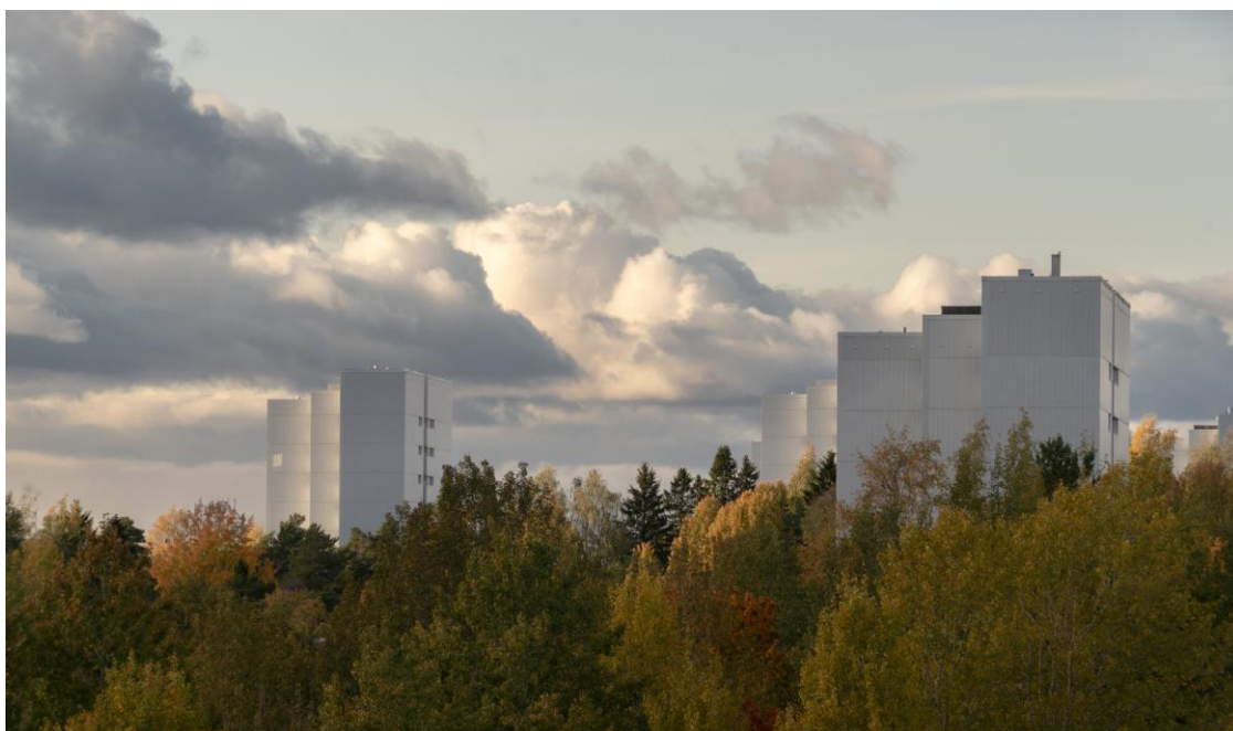
Kuva 3. Kerrostaloja metsän keskellä. Kuvan käyttö sallittu vain tämän artikkelin yhteydessä.

Asioiden katsominen tietoisena toimintana on verrattavissa kuvan katsomiseen. Nykyisessä vahvasti kuvallisessa kulttuurissa ympäristön kokemisessa korostuu näköhavainnon merkitys. Ilmiö ei ole uusi; tilan kokemisen teorioissa näkemistä on pidetty keskeisenä aistina vuosisatojen ajan. (Lehtinen 2015, 37.) Visuaalisen havainnon korostumista ja korostamista sanotaan myös estetisoinniksi. Estetisoiva katsoja keskittyy katsomaan kuvia, ja samalla myös muodostaa kuvia itse, ainakin mielessään.