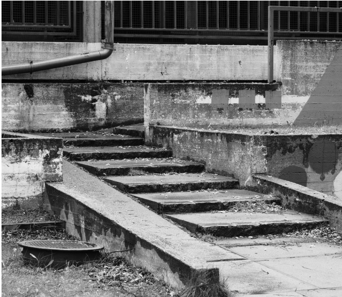
Kuva 10. Purkua odottavia betonirakenteita. Kuvan käyttö sallittu vain tämän artikkelin yhteydessä.