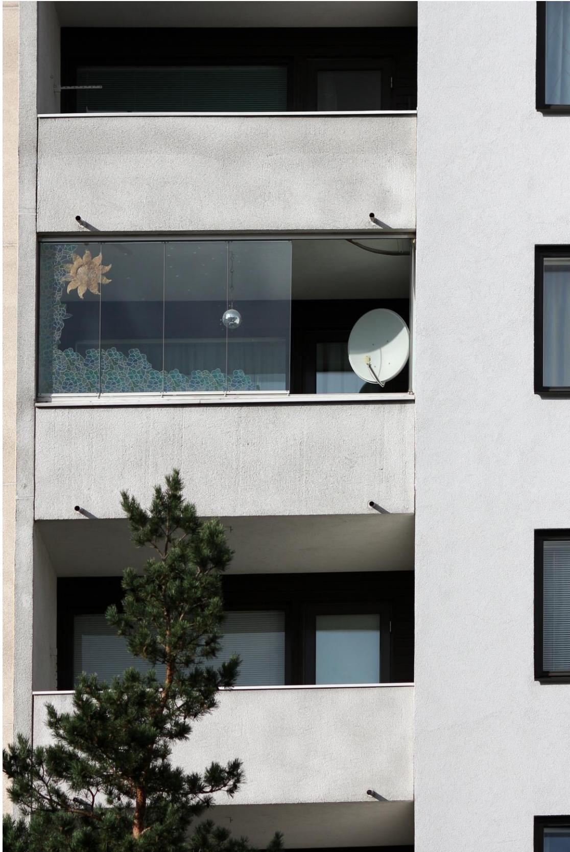
Kuva 2. Satelliittiantenni parvekkeella. Kuvan käyttö sallittu vain tämän artikkelin yhteydessä.