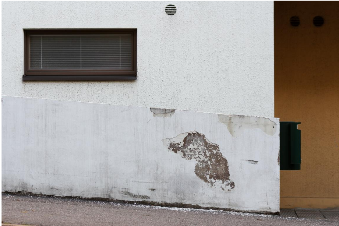
Kuva 6. Pintavaurio seinämässä. Kuvan käyttö sallittu vain tämän artikkelin yhteydessä.

Haastatteluissa kuviin liitettiin erilaisia tunnemerkitsejä, joiden katson edustavan punctumia, vaikka ne eivät tässä kontekstissa olleet erityisen voimakkaita. Turvallisuus ja rauhallisuus olivat useinkin kuvaajan mainitsemia ominaisuuksia. Turvallisuutta symboloi esimerkiksi pyykkiliniellä kuivuva pyykki (Kuva 7).