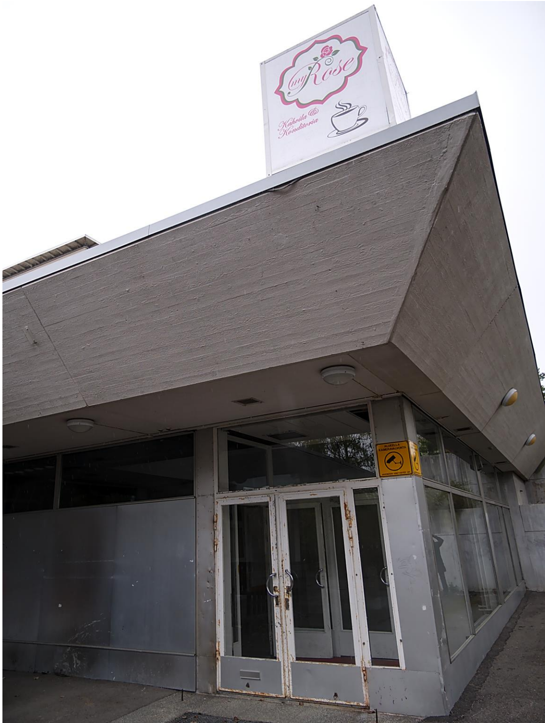
Kuva 9. Tyhjillään oleva liikerakennus. Kuvan käyttö sallittu vain tämän artikkelin yhteydessä.

Monissa lähiöissä on parhaillaan käynnissä laajoja uudistushankkeita, joissa ajallinen kerrostuma saa uusia tasoja. Myös toisen kuvauskohteena olleen alueen maisemaan on kuvausretken jälleen tullut uusi aikataso, sillä vanha koulurakennus (Kuva 10) purettiin ja viereen rakennettiin uusi.