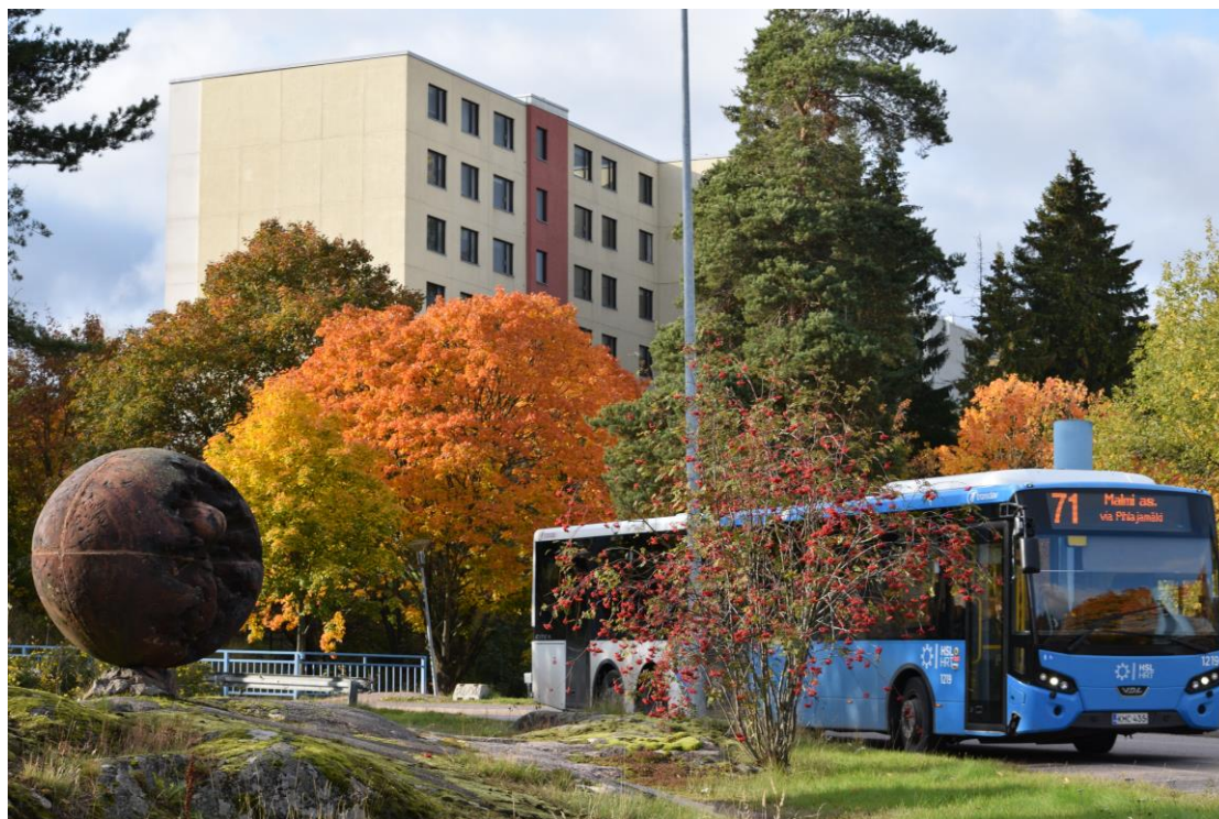
Kuva 4. Alkumuna-veistos, kerrostalo ja bussi. Kuvan käyttö sallittu vain tämän artikkelin yhteydessä.

Aineistossani dokumentaarista kuvaa edustaa esimerkiksi kuva, jossa näkyy yksi kerrostalo, puita, taideteos ja linja-auto (Kuva 4). Kuva esittää tilanteen sellaisenaan ja sisältää monenlaista informaatiota: puiden lehdet ovat oranssit, päivä on aurinkoinen ja kerrostalossa on useita kerroksia. Kuvassa on myös merkityksiä, joiden ymmärtäminen edellyttää pohjatietoa: moni helsinkiläinen tietää, että bussi numero 71 ajaa Itä-Helsingissä ja toiset tunnistavat myös erikoisen Alkumuna-veistoksen, joka on saanut innoituksen Kalevalasta. Luen kuvasta merkityksiä, joten se edustaa minulle studiumia.