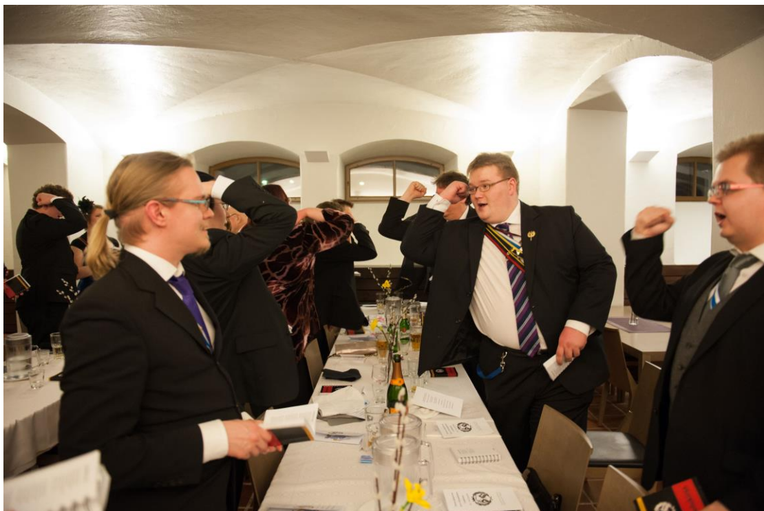
Kuva 1. Karjalaisten laulun yhteydessä nostetaan nyrkkiä kuten Karjalan vaakunassa. Kuva Savo-Karjalaisen osakunnan 89. vuosijuhlista 2014. Kuvaaja: Aake Kinnunen, kuvan käyttö sallittu vain tämän artikkelin yhteydessä.

Varsinkin kokemusta Karjalasta on tutkittu muistelun kautta, jolloin on todettu paikan näyttäytyvän erilaisena kokijasta riippuen (Fingerroos 2004). Toistuvien käytänteiden kautta osakuntalaisetkin tulevat hetkeksi osaksi maakunnan mielenmaisemaa (Korjonen-Kuusipuro & Kuusisto-Arponen 2017, 6). Maamme-kirjan aikaiset mielikuvat Savo-Karjalasta toistuvat niin haastatteluaineistossa kuin osakunnan KÄK-lehden artikkelissa, jossa etsittiin osakunnasta stereotyyppisiä savolaisia ja karjalaisia piirteitä (Agge 2014, 8). Savo-Karjalaisessa osakunnassa Karjala näyttäytyy etenkin Karjalaisten laulua laulettaessa. Viimeisessä säkeistössä "Karjalasta kajahtaa" -huudahduksen aikana nostetaan nyrkkiä kuten Karjalan vaakunassa ikään (Kuva 1). Eräs haastatelluista toteakin, että toisten maakuntalaulujen laulaminen elähdyttää enemmän kuin toisten (SKO8). Karelialismista ei tosin ole kyse, sillä laulujen lisäksi maakuntatuntemointi rajoittuu maakuntamatkailuun ja perinneruokiin. Toisin kuin Karjalan evakoiden kohdalla, kyse ei ole koetun muistelemista vaan mielikuvien Karjalan kokemista. Fingerroos (2004) nostaa Karjalan osaksi kansallista Suomimyyttiä. Hänen mukaansa siirtokarjalaisten utopioissa on kyse sekä unohduksesta että mielikuvien hämärtymisestä ja muuttumisesta. Ehkä vielä maakuntakerhojen aikaan ennen 1950-lukua maakunta-aate oli konkreettisempi, mutta nyt siihen sekoittuu paljon väkeviä mielikuvia, kuten juuri nyrkkiä heristävä taisteleva karjalainen.